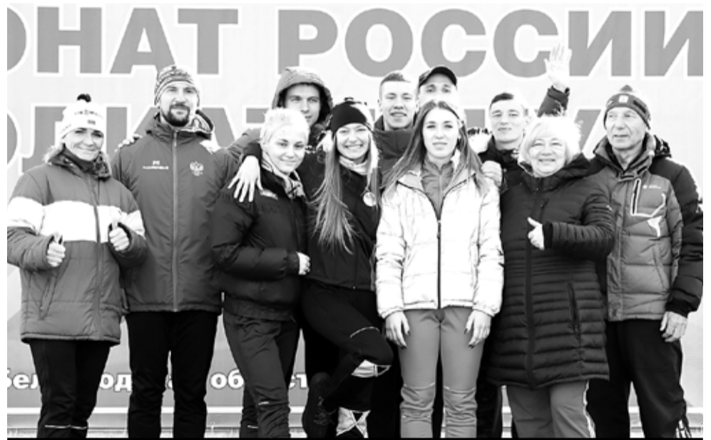
Команда Белгородской области