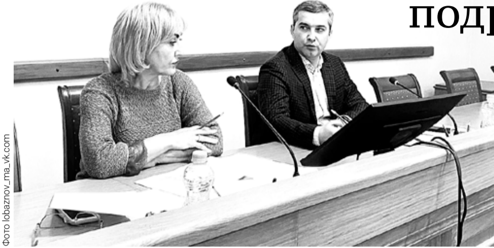
Заседание коллегии при главе администрации состоялось 23 ноября.

Члены коллегии, должностные лица администрации, главы территориальных администраций, руководители предприятий обсудили вопросы культурно-просветительской деятельности, как средство гражданско-патриотического воспитания подрастающего поколения в учреждениях культуры округа и национальный проект «Образование»: от ключевых мероприятий к социальным эффектам.