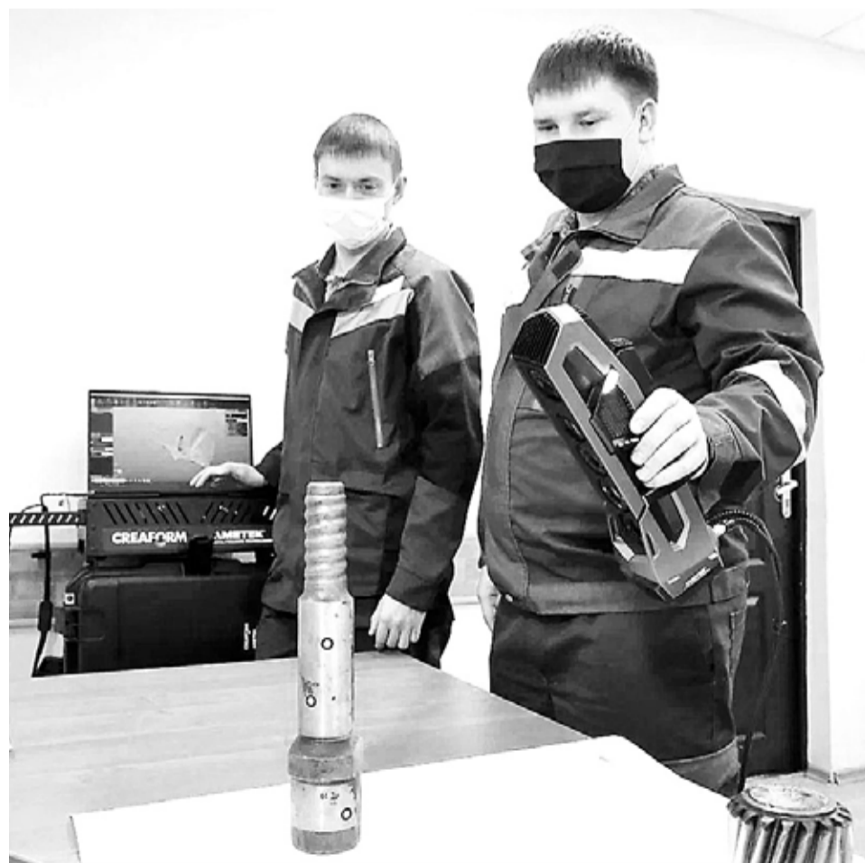
Сканирование повышает точность измерений, а компьютерная модель детали готова уже через несколько минут