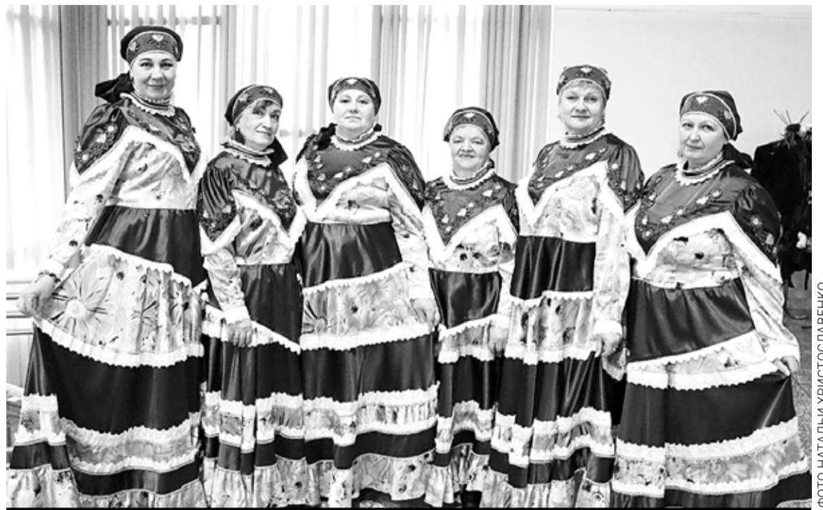
Вокальный ансамбль «Ивушка» Мелавского Дома культуры

Начались выступления, и ты понимаешь — как сложно выбрать лучших. Особенно восхищались народные песни. Конкурсанты продемонстрировали глубину,