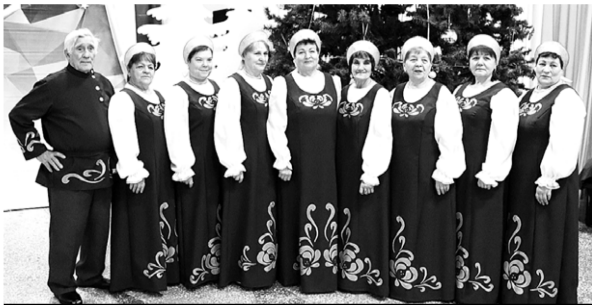
Вокальный ансамбль «Забавушка» Богородицкого Дома культуры