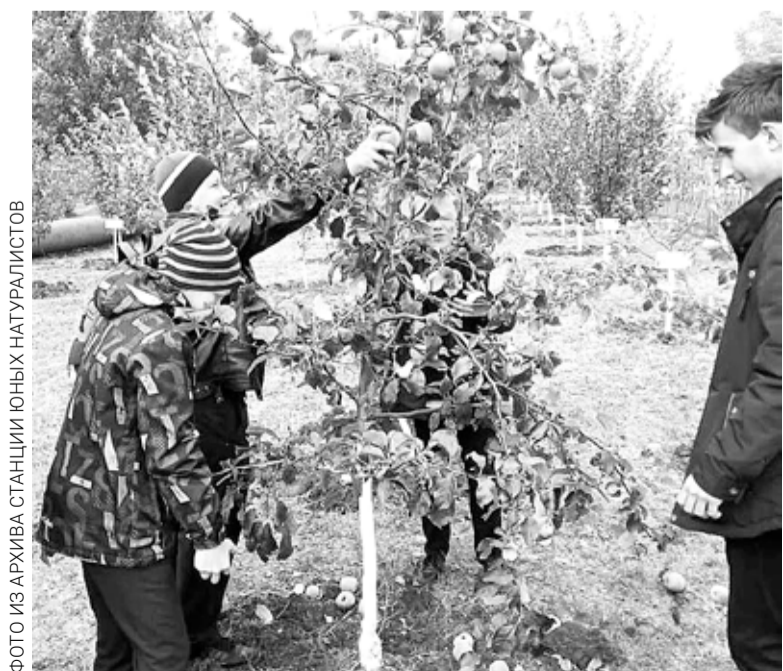
Члены ученической бригады «Яблочко» собирают урожай