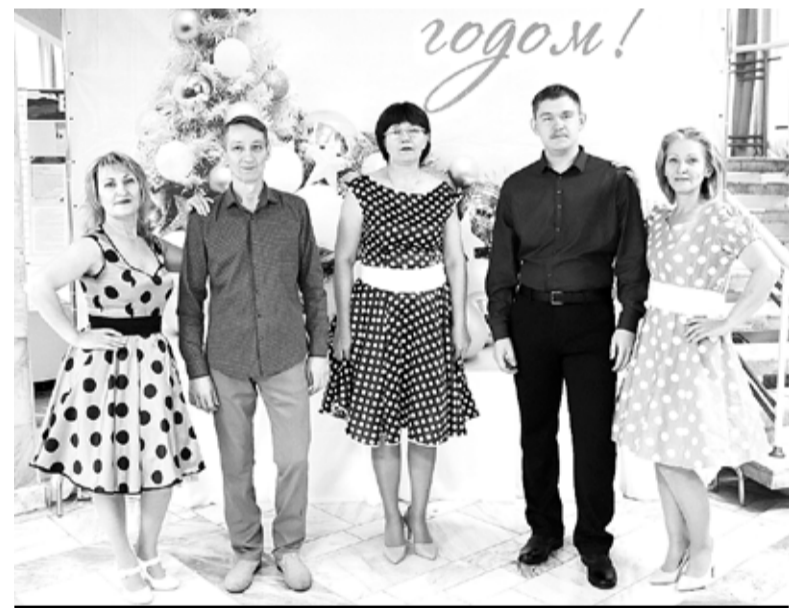
Вокальный ансамбль «Визит» Вислудубравского Дома культуры